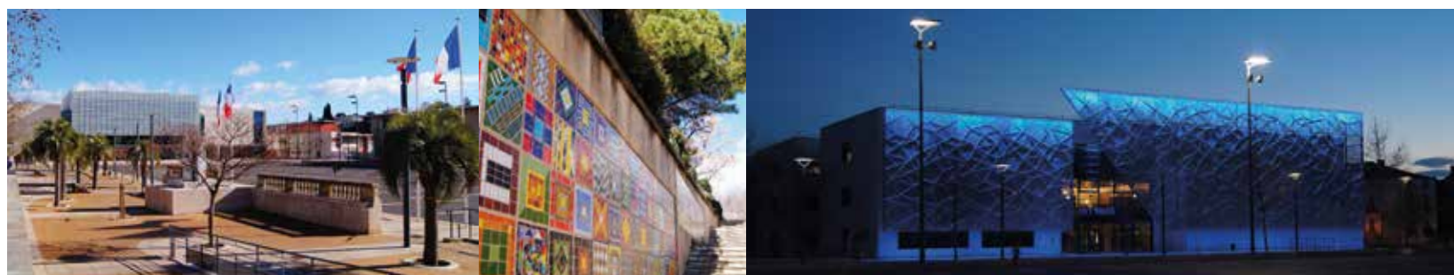
Le quartier du Champ de Mars

Les commodités du quotidien ne sont pas en reste, puisque le quartier compte de multiples commerces et services de proximité, des infrastructures scolaires et sportives ; sans oublier une desserte parfaite par les transports en commun , ainsi qu'un accès rapide aux zones commerciales et grands axes routiers.