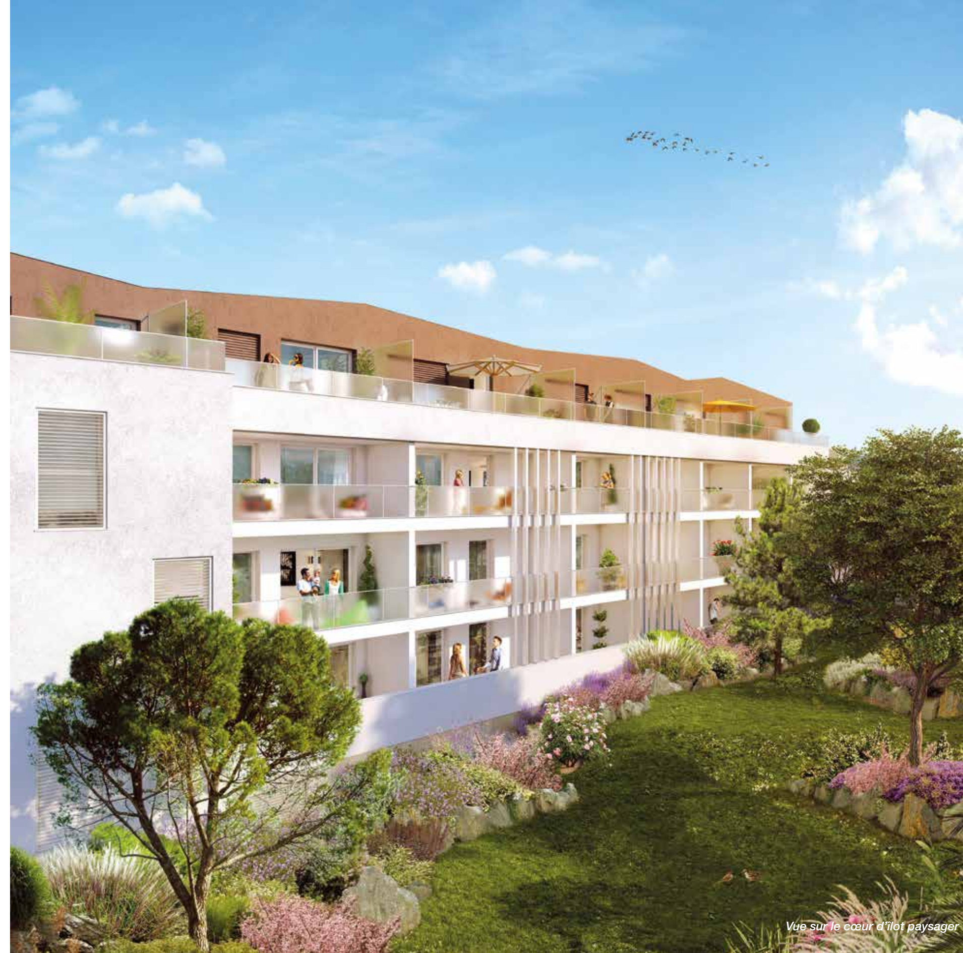
Vue sur le cœur d'îlot paysager